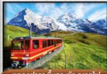
เขา Jungfrau ขึ้นกระเช้า รถไฟ