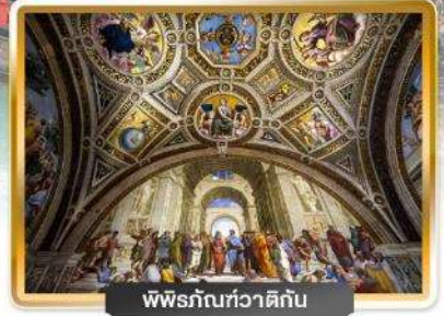
พิพิธภัณฑท์วาติกัน