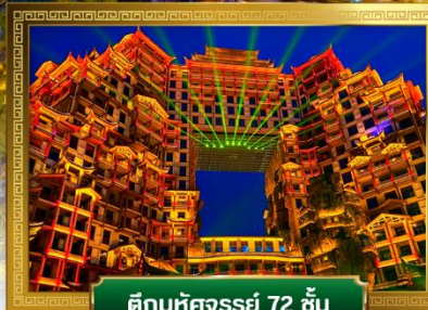
ตึกมหัศจรรย์ 72 ชั้น