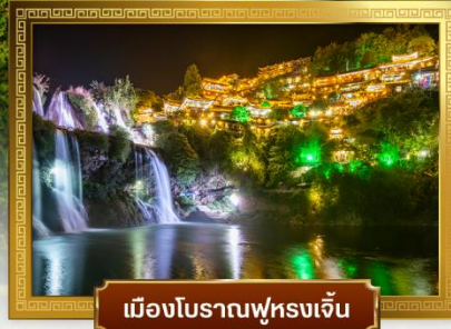
เมืองโบราณฟุ่หลงเจิน