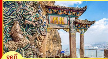
จุดที่ 5 ชั้นประตูมังกร