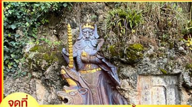
จุดที่ 1 เทพเจ้าไฉซิงเอี้ย หรือ เทพเจ้าแห่งโชคลาภ