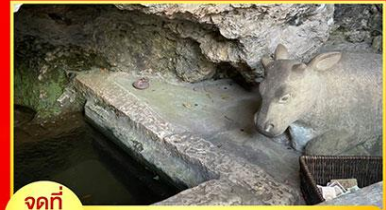
จุดที่ 3 บ่อน้ำศักดิ์สิทธิ์วังคตัญญู