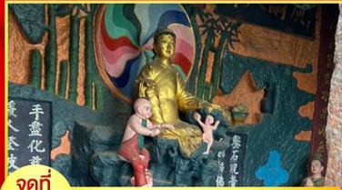
จุดที่ 4 ศาลเจ้าแม่กวนอิมสูงลูก