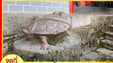
จุดที่ 2 รูปปั้นงูพันเต่า วัง ศาลเจ้าฟ้อฮ้อ