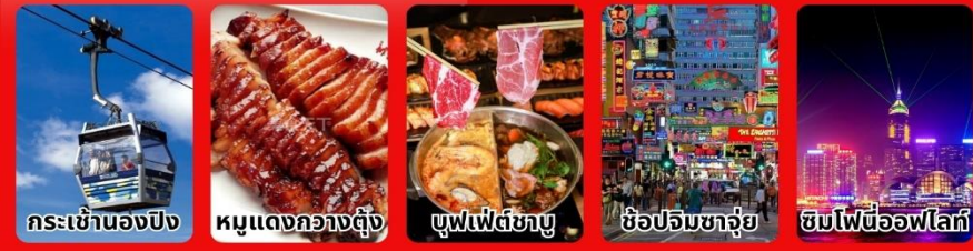
กระเช้าฮ่องกง