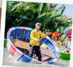
ล่องเรือกระดังง์