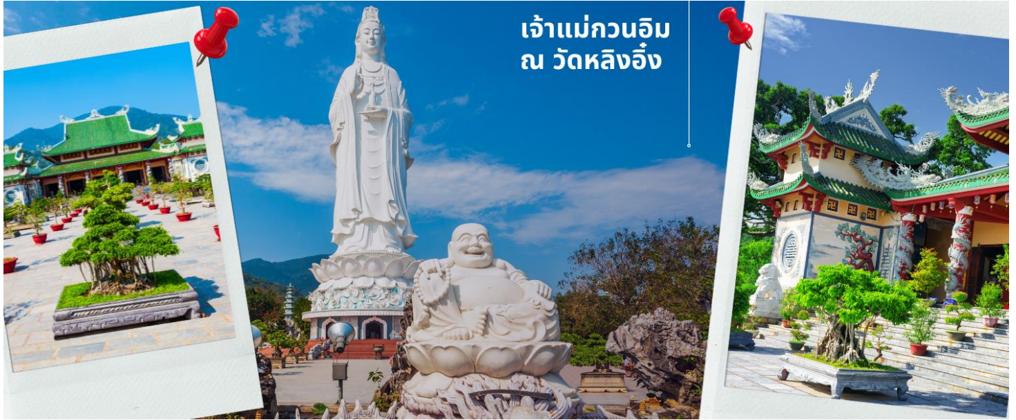
เจ้าแม่กวนอิม ณ วัดหลิงอิ่ง

นำท่านมัศจรรย์องค์ เจ้าแม่กวนอิม ณ วัดหลิงอิ่ง อยู่บนเกาะเซินตรา (Son Tra) ทางเหนือของเมืองดานัง เป็นวัดใหญ่ที่สุดของที่นี่ รูปปั้นปูนขาวของเจ้าแม่กวนอิมยืนหันหลังให้ภูเขา หันหน้าออกสู่ทะเลเพื่อเป็นการปกป้องคุ้มครองชาวประมงที่ออกไปหาปลา เสียงระฆังวัดที่ดีประสานกับเสียงคลื่นนั้นช่วยให้ชาวเรือรู้สึกสงบ