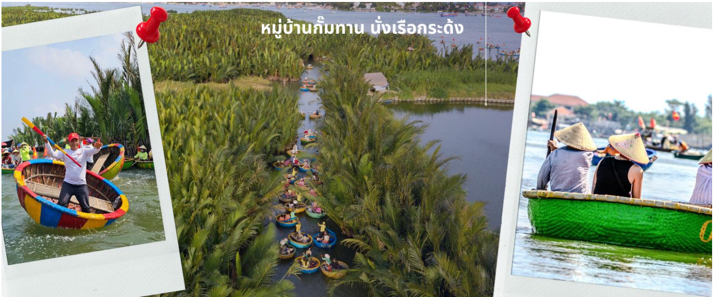
หมู่บ้านกัมทาน นั่งเรือกระดง

เที่ยง รับประทานอาหารเที่ยง ณ ภัตตาคาร (4) จากนั้นนำท่านผ่านชม ภูเขาหินอ่อน Marble Mountains และนำท่านเข้าชม หมู่บ้านแกะสลักหินอ่อน ที่มีแหล่งวัดตูปหินอ่อนเหนือดี และช่างแกะสลักฝีมือประณีต ส่งออกจำหน่าย ทั่วโลก จากนั้นนำท่านเดินทางสู่ หมู่บ้านกัมทาน สนุกสนานไปกับการเล่นกิจกรรม นั่งเรือกระดง เป็นหมู่บ้านเล็กๆ ในเมืองฮอยอันตั้งอยู่ในสวนมะพร้าวริมแม่น้ำ ในอดีตช่วงสงครามที่นี่เป็นที่พักอาศัยของเหล่าทหาร อาชีพหลักของคนที่นี่คืออาชีพประมง ระหว่างการล่องเรือท่านจะได้ชมวัฒนธรรมอันสวยงาม ชาวบ้านจะขับร้องเพลงพื้นเมือง ผู้ชายกับ