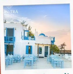
ซานตารีนาคาเฟ่