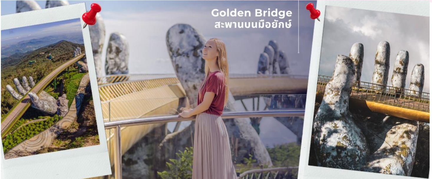
Golden Bridge สะพานบนมือยักษ์

เที่ยง รับประทานอาหารเที่ยง ณ ภัตตาคาร (4) จากนั้นนำท่านผ่านชม ภูเขาหินอ่อน Marble Mountains และนำท่านเข้าชม หมู่บ้านแกะสลักหินอ่อน ที่มีแหล่งวัดตูปหินอ่อนเหนือดี และช่างแกะสลักฝีมือประณีต ส่งออกจำหน่าย ทั่วโลก จากนั้นนำท่านเดินทางสู่ หมู่บ้านกัมทาน สนุกสนานไปกับการเล่นกิจกรรม นั่งเรือกระดง เป็นหมู่บ้านเล็กๆ ในเมืองฮอยอันตั้งอยู่ในสวนมะพร้าวริมแม่น้ำ ในอดีตช่วงสงครามที่นี่เป็นที่พักอาศัยของเหล่าทหาร อาชีพหลักของคนที่นี่คืออาชีพประมง ระหว่างการล่องเรือท่านจะได้ชมวัฒนธรรมอันสวยงาม ชาวบ้านจะขับร้องเพลงพื้นเมือง ผู้ชายกับ