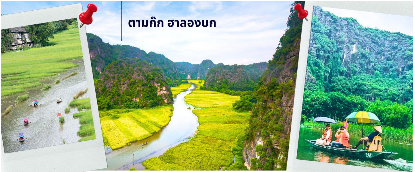
ตามก๊ก ฮาลองบก

จากนั้นนำท่านเดินทางสู่ ตามก๊ก เป็นพื้นที่ที่มีทิวทัศน์อันงดงามของยอดเขาหินปูน แม่น้ำหลายสาย ไหลลัดเลาะ บางส่วนจมอยู่ใต้น้ำ และยังคงล้อมรอบด้วยผาสูงชัน จึงทำให้สถานที่แห่งหนึ่งงดงามน่าชม การขึ้นชมทัศนียภาพที่สวยงามในจางอานนั้น คือการล่องเรือเล็กประมาณลำละ 4-5 คนเพื่อเข้าไปเยี่ยมชมจางอาน เรือแจวก็คือพาเราไปเยี่ยมชมวัด หลังจากนั้นก็จะพาเราไปลอดถ้ำ มีทั้งหมด 49 ถ้ำ ซึ่งแต่ละถ้ำจะมีชื่อแตกต่างกันไปจะใช้เวลาล่องเรือไปกลับร่วมสองชั่วโมงเลย ที่เดียว จางอานยังถูกเรียกว่า ฮาลองบก เพราะที่นี่มีเขาหินปูนและถ้ำคล้ายกับที่อ่าวฮาลอง