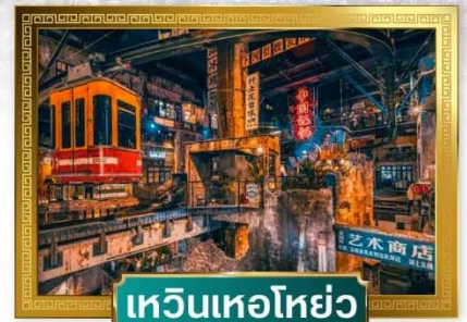
เหวินเหอโฮ่ย