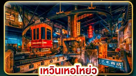
เหอหวงโบราณ