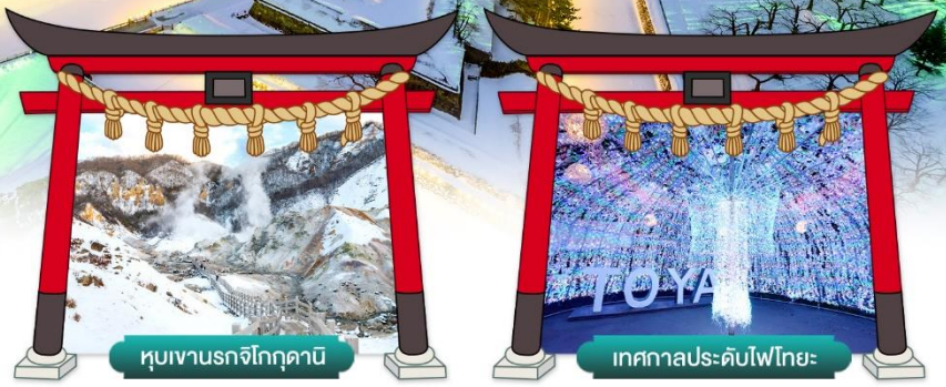
หุบเขานรกจิกุกุคานี