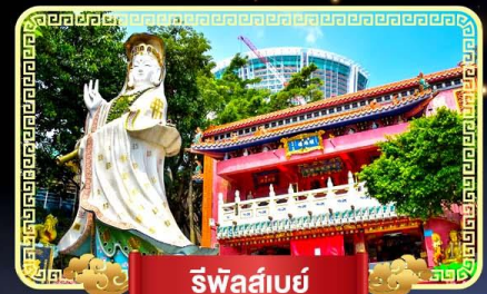
รีพัลส์เบย์