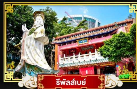
รีพัลส์เบย์