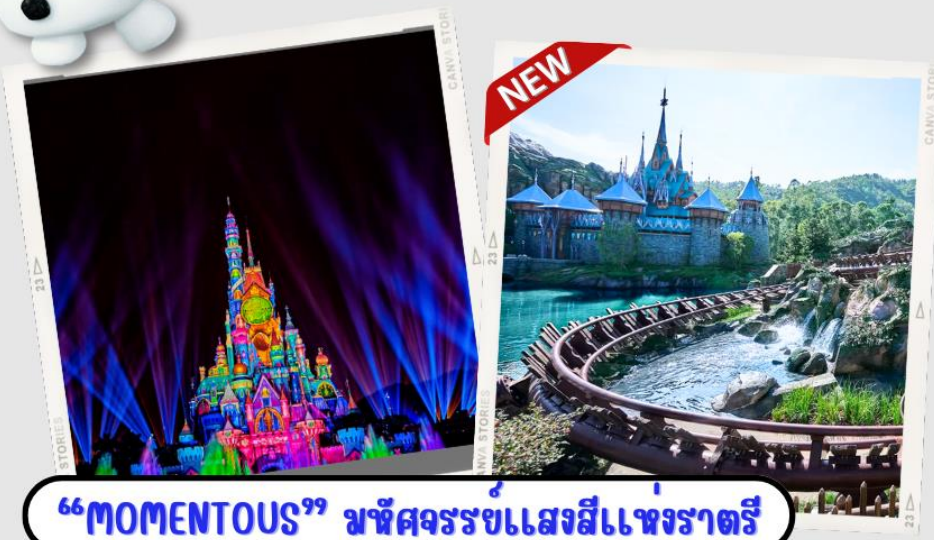
“MOMENTOUS” มหึศจรรย์ขแสงสีแห่งราตรี