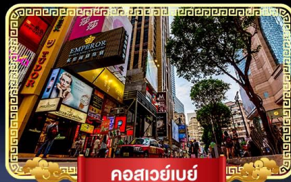
คอสเวย์เบย์