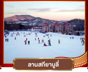
ลานสกียาบูลี่