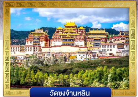
วัดชงจ้านหลิน