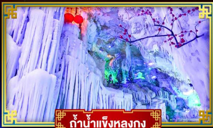
ตำนานเจิ้งหลงกง

"เที่ยว 2 มณฑล กวางซี-ก๊วยโจว" สุดอลังการ น้ำตก 2 พรมแดน แหล่งท่องเที่ยวระดับ 5A