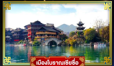
เมืองโบราณเซี่ยซือ