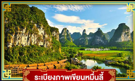
ระเบียบภาพเขียนหมื่นลี้