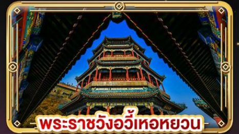
พระราชวังอู่เหอหยวน