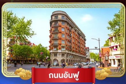
ถนนอันฟู