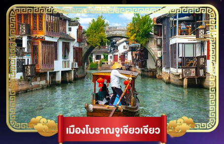
เมืองโบราณจูเจียวเจียว