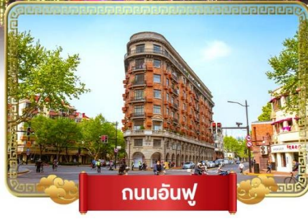
ถนนอันฟู