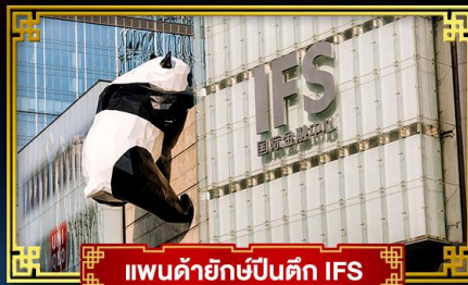
แพนด้ายักษ์ปิ่นตึก IFS