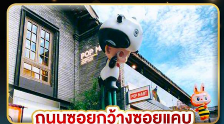
ถนนชอยกว้างชอยแคบ