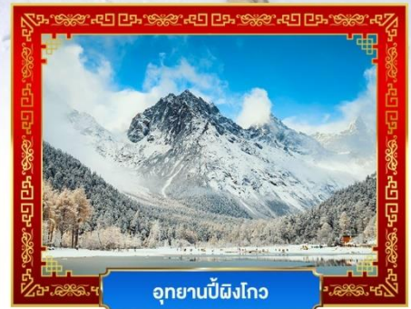
อุทยานปี้ผิงโกว