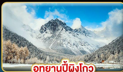
อุทยานปี้ผิงโกว