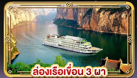
ล่องเรือเขื่อน 3 ภา