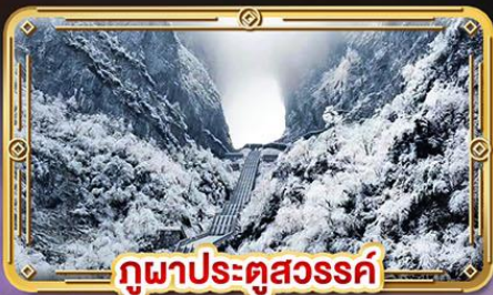
ภูเขาประตูสวรรค์