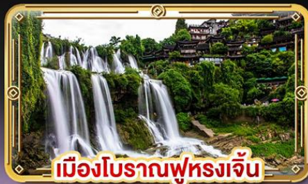
เมืองโบราณฟุหลงเจิ่น