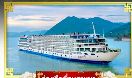
ล่องเรือเพื่อนสามผา