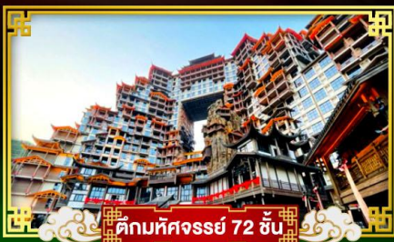
💡 ตึกมหัศจรรย์ 72 ชั้น