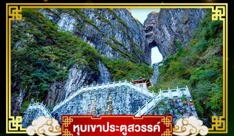
🏞️ ภูเขาประตูลิขิต