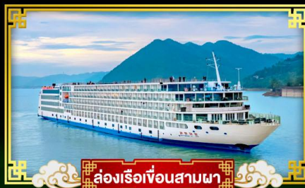
🚢 ล่องเรือเขื่อนสามผา