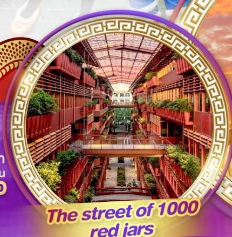
The street of 1000 red jars

สักการะพระใหญ่หลิงซานต้าฟอ ถ่ายรูปคู่กันดิมยักซ์ ชมสุดยอดพุทธศิลป์ร่วมสมัยของจีน "ศาลาฟานกง"