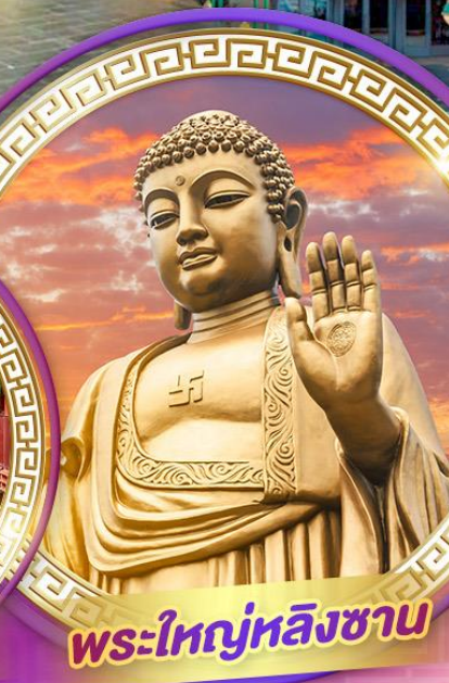
พระใหญ่หลิงซาน