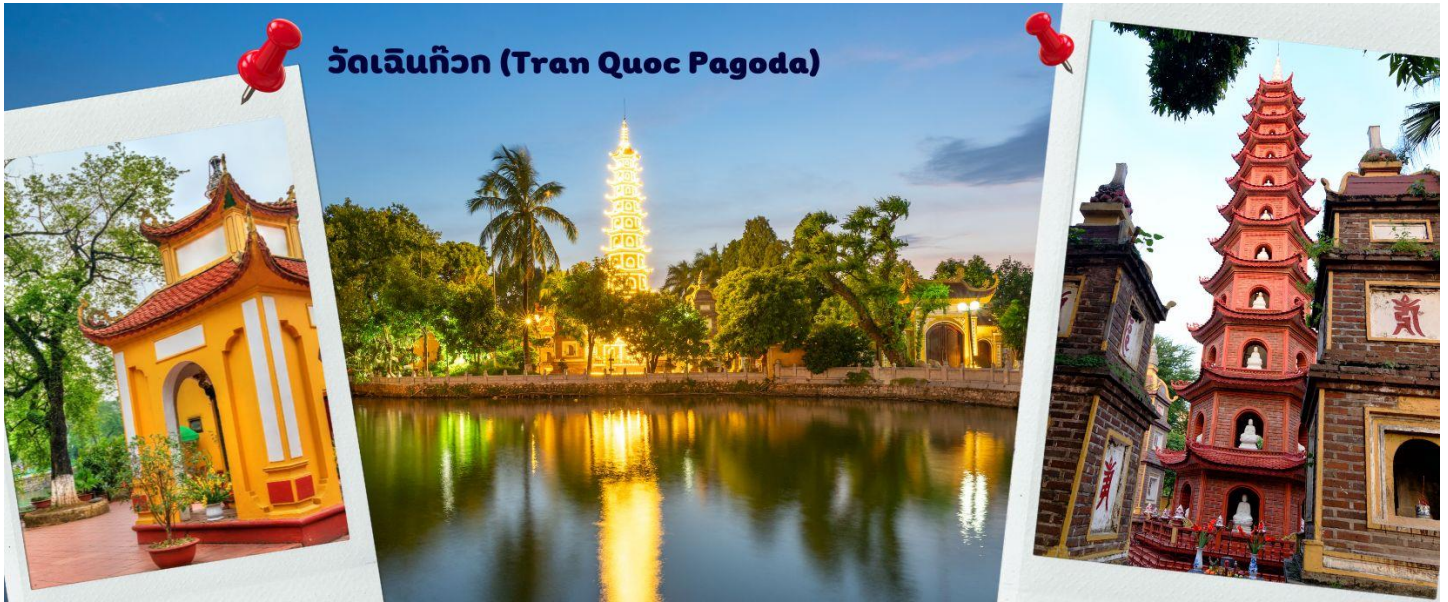
วัดเจดีย์กว (Tran Quoc Pagoda)

ผังเป็นอย่างดี ใช้สีสันทึกลับมกลืนในโทนสีเหลือง น้ำตาล ตัดกับสีเขียวของต้นไม้ใหญ่ที่โอบล้อมอยู่ในมุมถ่ายภาพจากอีกฝั่งหนึ่ง จะเห็นสิ่งปลูกสร้างสไตล์จีน และเจดีย์หลายชั้นโดดเด่น มีภาพที่สะท้อนลงสู่ผิวน้ำเป็นภูมิทัศน์ที่งดงามทั้งยามกลางวันและยามค่ำคืนที่มีการเปิดไฟส่องสว่าง