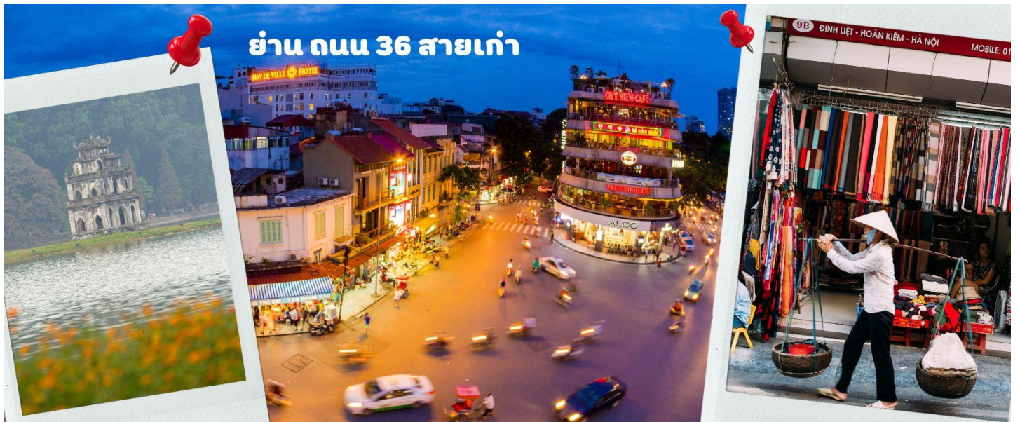
ย่าน ถนน 36 สายเก่า

จากนั้นให้ท่านได้ อิสระช้อปปิ้ง ถนนสาย 36 street แหล่งช้อปปิ้งของฮานอย มีต้นไม้ปกคลุมสองฝั่งถนน สาเหตุที่ชื่อถนน 36 มาจาก 36 อาชีพที่ทำการค้าขายบนถนนแห่งนี้ ตั้งแต่อดีตอย่างงานด้านหัตถกรรมสอดคล้องกับชื่อถนนแต่ปะเล้น ในอดีตอย่าง เครื่องเงิน ผ้าไหม บนถนนแห่งนี้ แต่ปัจจุบันมากกว่า 36 ไปแล้ว ที่นี้จะเป็นแหล่ง Shopping มีสินค้าเกือบทุกชนิด ร้านขายชุดกีฬาทุกแบรนด์เพราะที่นี้เป็นแหล่งผลิตให้หลาย ๆ แบรนด์