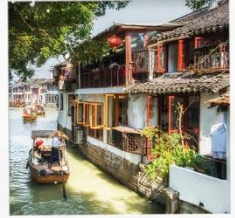
เมืองโบราณจูเจียวเจียว