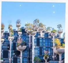
Tian An 1,000 Trees Square